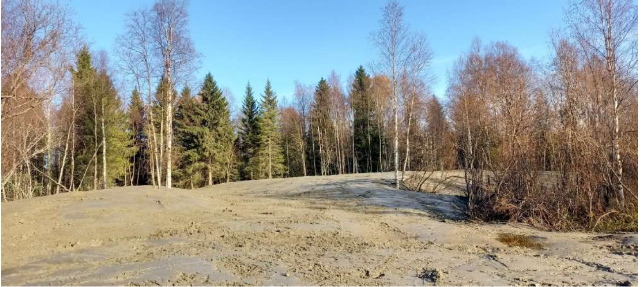
Läjäytysalue maisemoinnin jälkeen