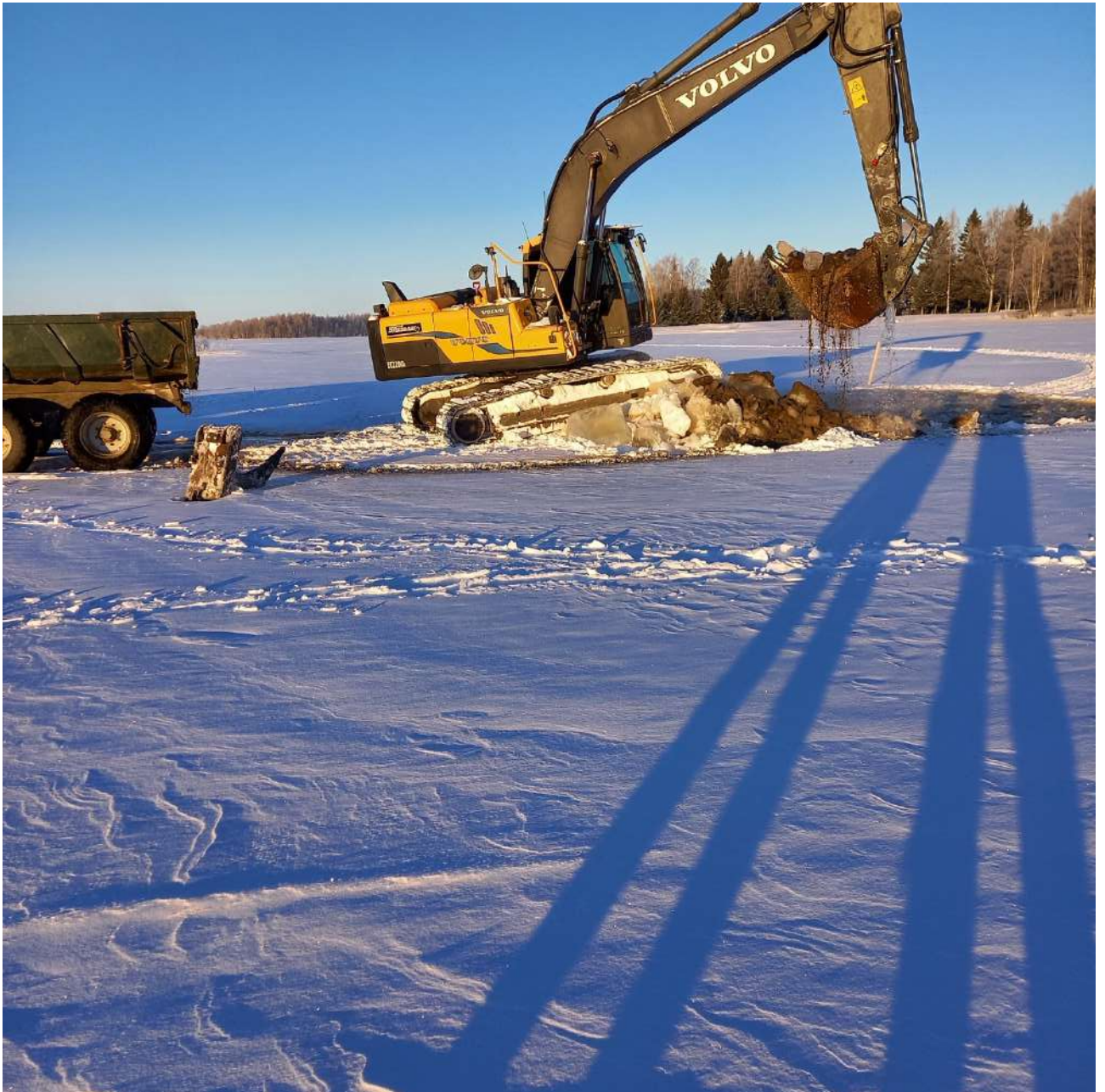
Ensimmäiset kauhalliset jääpatjan päältä. Ruoppaukset alkupää jokisuun puolella 24.02.2023