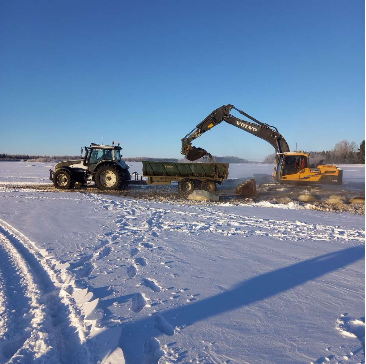
Kolme traktoria ajoi ruoppausmassaa läjityspaikalle jatkuvana ketjuna.