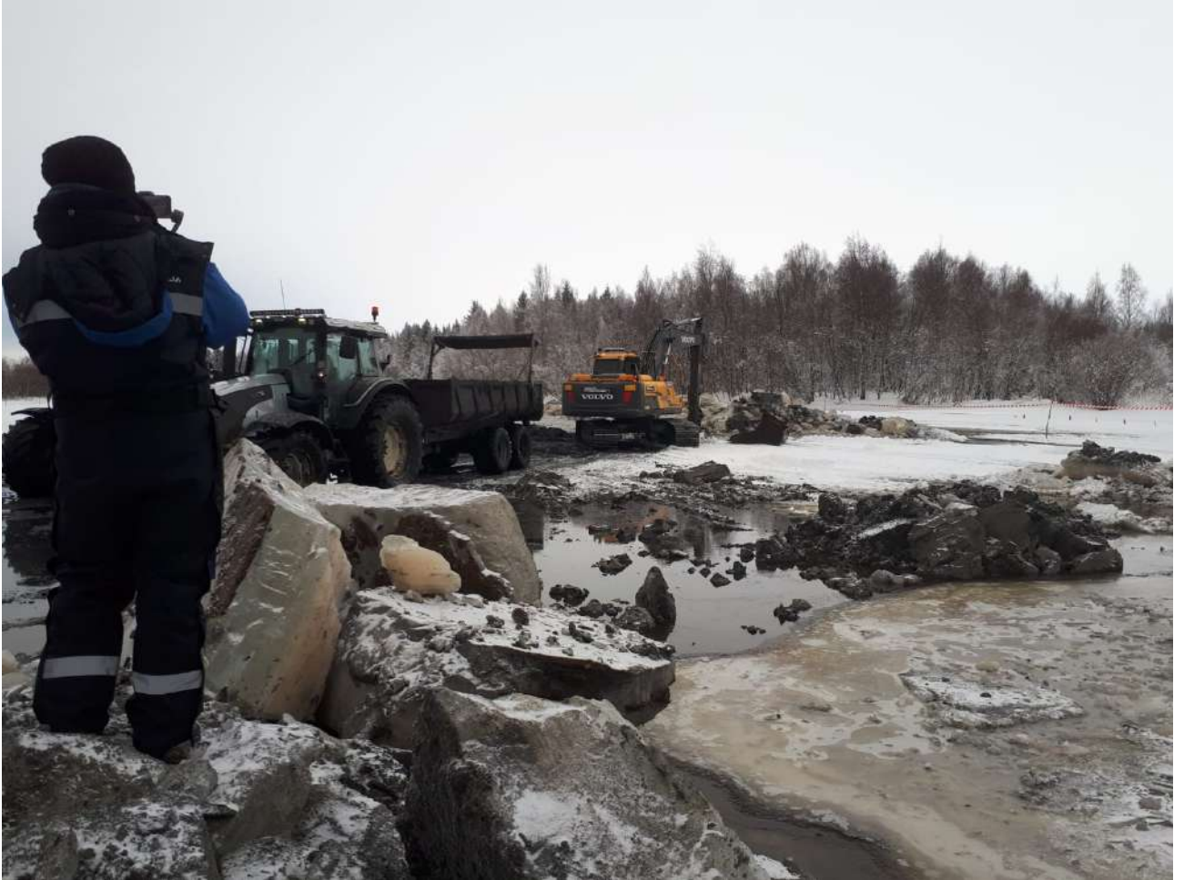
Ylen toimittaja kuvaa työmaata.